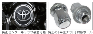
純正センターキャップ装着可能 純正の「平座ナット」対応ホール