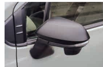
マットブラックドアミラーカバー (純正加工品 左右セット)

純正ではボディ同色となっているドアミラーカバーをマットブラック化することでアクセントを演出。 純正加工品のため取付方法は純正と全く同じの交換作業となり、後付け感も無し。左右セット。