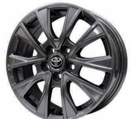
※記載の価格にはナットとセンターキャップは含まれません。