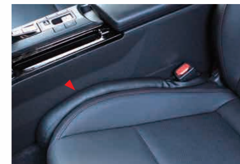
05 LX シートサイドクッション

運転席・助手席とセンターコンソールの間に挟んで隙間を埋めることで小物などが入り込んでしまうのを防げるクッション 2 点セット。シートベルトバックルを通す設計で、座面先端から後ろまで綺麗に隙間をなくせます。内表に合わせたブラック、ベージュ、ブラウン、グレーの 4 色を設定。