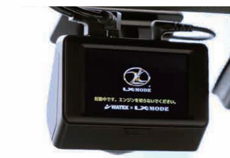
08 ドライブレコーダー「DVR-360HGT」

メインカメラの全方位360°+垂直視野角約220°記録機能にプラスし、ブラケット内蔵のGPS機能と、360°レコーダーとしては先進の「SDカードフォーマットフリー」機能を追加。車前後方を録画するためのリアカメラも付属する 2カメラ録画で、全方位の状況をより的確に・より多くの情報を記録することが可能。3 インチ画面の小型で取り回しやすいサイズとしながら、さらに充実の機能を持たせたフラッグシップモデル。