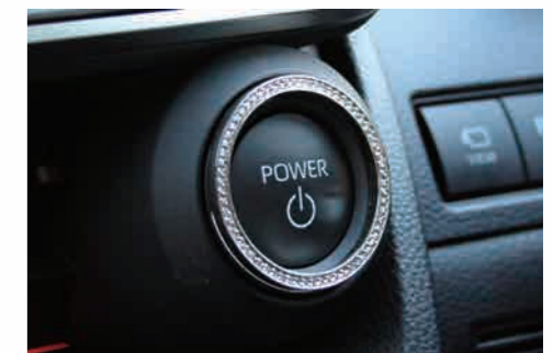
06 LX ラインストーンリング A-Type (エンジンスタート/ストップボタン)

エンジンスタートボタン外周部にストラス スワロフスキーコンポーネントを散りばめ高級感を演出。A-Type のサイズは「外径=41mm×内径=35mm」。リングは真鍮削り出しクロームメッキ仕上げ。ブラックダイヤ、グリーン、パール、レッド、イエローの 5 色設定。