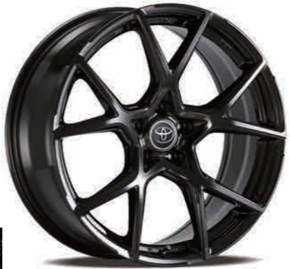
※ホイールにセンターキャップは付属されません。