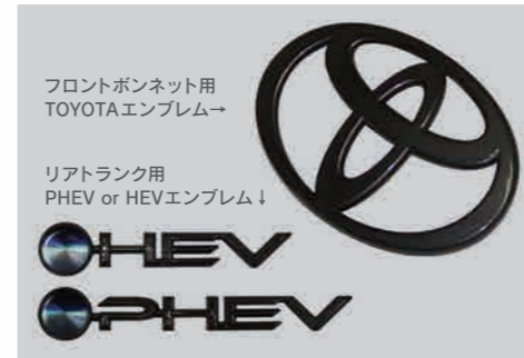
04 ダークメタリックエンブレム (フロント/リアセット)

LX-MODE のアイデンティティーであるウイングデザインレリフをフロントスポイラーに復刻。フロントスポイラーのみの装着で車両全体のイメージチェンジを図れるフロントフェイスメイキングデザインを採用。更に純正フェンダーガーニッシュにアドオン装着するカラードオーバーフェンダーはワイドアンドローフォルムを表現。ABS樹脂素材を使用した日本国内生産品。