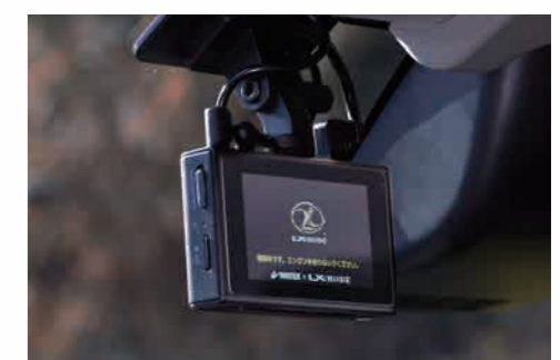
09 ドライブレコーダー「DVR-180HGT」

フロントメインカメラ約110°+リアカメラ約115°の広角前後カメラにプラスし、ブラケット内蔵のGPS機能と、近年では必須となっている「SDカードフォーマットフリー」機能も搭載。リーズナブルな価格と多機能の両立を目指した意欲的な 2カメラモデル。