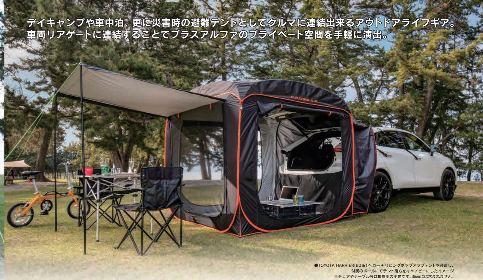
●TOYOTA HARRIER(80系)ヘカー+リビングポップアップテントを装着し、付属のポールにてテント後方をキャンビにしたイメージ。 ※チェアやテーブル等は撮影用の小物です。商品には含まれません。