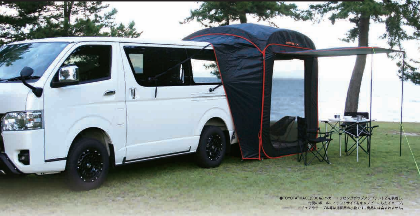
●TOYOTA HIACE(200系)ヘカー+リビングポップアップテント2を装着し、付属のポールにてテントサイドをキャンビにしたイメージ。 ※チェアやテーブル等は撮影用の小物です。商品には含まれません。