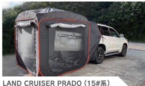
LAND CRUISER PRADO (15#系)