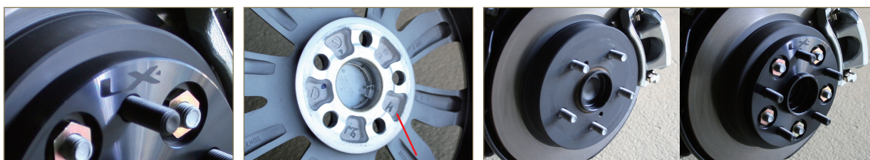
表面に「LX」の刻印入り