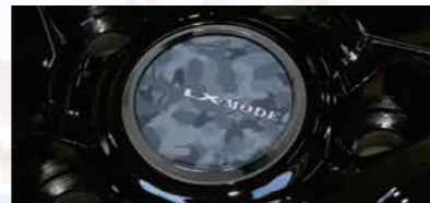
LX MEISAIセンターキャップ (オプション)

※写真の各種純正センターオーナメントは純正品を流用した装着イメージです。ホイールには付属されませんのでご了承ください。