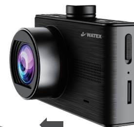
フロントガラス側